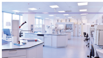
第三方检测实验室